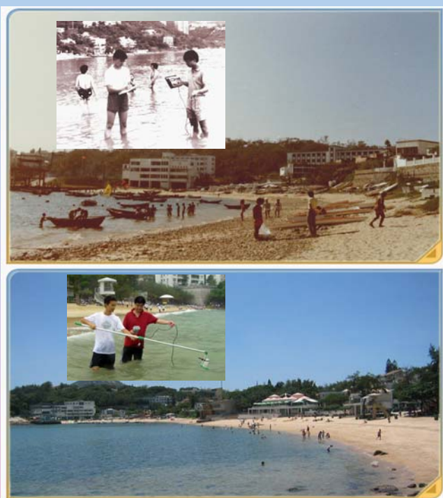
赤柱正灘1980年代初（上圖）與2008年（下圖）外貌的比較。 插圖為當時的泳灘水質監測隊

評為「良好」級別（即最高級別）的泳灘由1986年的23%大幅增加至2011年的76%。